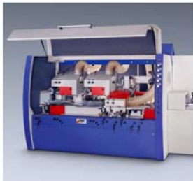
Modanatrice, Weinig Gruppe

Per effettuare lavori di piallatura e di profilatura vengono spesso impiegate delle modanatrici (piallatrici a spessore a più utensili). La sezione per la prevenzione sul lavoro e la tecnica di sicurezza Fulda dell'ufficio del governo regionale di Kassel ha rilevato, nel caso di una macchina di questo genere, valori di emissione sonora molto elevati, la cui causa è stata individuata nelle corrispondenti norme. Un gruppo di lavoro della KAN ha elaborato delle proposte per l'ulteriore procedura da adottare.