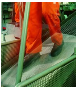
Determinazione de la resistenza allo scivolamento - superficie inclinata, BGIA

Gli incidenti provocati dallo scivolamento sono spesso da ricondursi ad una sfavorevole interazione fra soles delle calzature, pavimentazioni ed una sostanza scivolosa come l'acqua o l'olio. Per facilitare, sul posto di lavoro, la scelta di scarpe e pavimentazioni adeguate è utile classificare le proprietà antiscivolo di queste ultime, per es. all'interno delle norme. In considerazione dei differenti approcci di prova adottati per calzature e pavimentazioni nelle norme europee attualmente elaborate, questo compito si prospetta, anche per il futuro, difficoltoso.